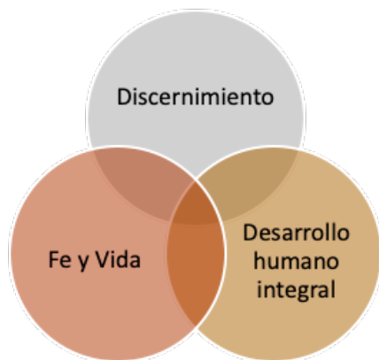
Esquema 1: Macro categorías fundamentales

Tal como se muestra en el esquema 1, se constataron ciertas líneas generales compartidas por los grupos, incluso existiendo una diversidad en las dinámicas y categorías que surgen de cada uno de ellos. En ese contexto, un aspecto común entre las encuestas aplicadas 21 , la entrevista grupal y los grupos focales, fue la constatación de que la crisis eclesial, ya siendo algo decantada por el paso del tiempo, marca pauta en las reflexiones sobre laicado y formación. De esta manera, se reconocen macrocategorías como discernimiento , síntesis entre fe y vida y desarrollo humano integral que son transversales a todo el levantamiento de información, marcando un claro énfasis en las preocupaciones para la formación laical y la renovación de la vida eclesial. El currículum de la formación del laicado debe responder