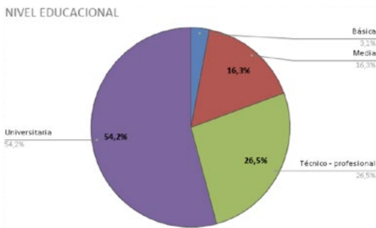
Gráfico 2: Distribución según nivel educacional

Un dato que se destaca, pues problematiza muchos supuestos generalizados sobre la formación, es el nivel educacional de los encuestados. Tal como señala el gráfico 2, los laicos que se forman manifiestan en un 26,5% haber cursado o estar cursando Educación Técnico-Profesional y un 54,2% en Educación Universitaria, dejando un porcentaje del 80,7% con algún grado en Educación Superior. Este indicador se condice con las cifras del Censo Nacional 2017, donde se estableció un promedio de 11,05 años de escolaridad en personas de 25 años o más; como también en el acceso a la Educación Superior, la proporción de personas de 25 años o más que ha aprobado al menos un curso de la educación superior se incrementó a 29,8%. Por consiguiente, el laicado que accede a las formaciones tiene un nivel educativo superior (80,7%), lo que permite un diseño de formaciones con mayor profundización y exigencias pedagógico-pastorales.