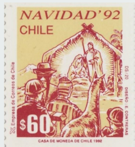
Imagen 5 Navidad 1992