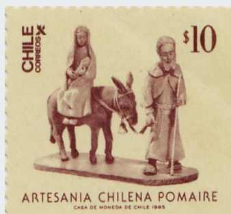
Imagen 3 Sagrada Familia de greda en el contexto de la emisión "Artesanía de Pomaire", 1985