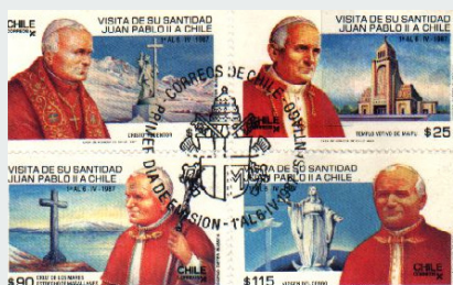
Imagen 4 Sobre del primer día de emisión del conjunto de sellos que conmemoran la "Visita de su santidad Juan Pablo II a Chile"

El cuarto sello destaca la visita de la mayor autoridad de la Iglesia católica, el Papa.