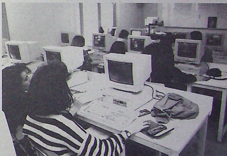
Laboratorio de Computación equipado con computadores del ambiente IBM.

Por último, la Universidad Finis Terrae fue una de las primeras universidades privadas que se unió a una red satelital internacional de intercambio de información y archivos. Para este efecto, mediante la firma de un convenio con la Universidad Católica de Chile, nuestra universidad se ha integrado a UNIRED, sistema de acceso a las bases de datos de las principales bibliotecas, archivos, centros de investigación y universidades del mundo que opera a través de una conexión satelital a INTERNET, red administrada por la National Science Foundation de los Estados Unidos, que hoy opera en más de cuarenta países y sirve a más de 30 millones de usuarios repartidos en todos los continentes.