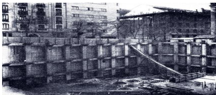
Foto 3: Edificio INGESA en construcción (Identificación del CEHOPU: I/FC-064/006).