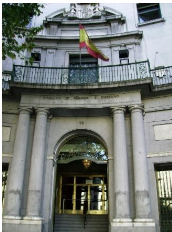
Foto 4: En la actualidad, entrada principal del Instituto Nacional de Gestión Sanitaria (INGESA), por la calle Alcalá nº 56.