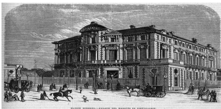
Foto 1: Palacio del Marqués de Portugalete en Madrid. Grabado a partir de la fotografía de Juan Laurent, según la revista La Ilustración de Madrid (1870).