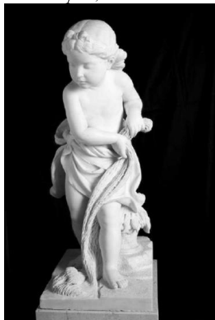
Foto 9: Giovanni Lombardi, Niña jugando con redes de pescar , 1869.