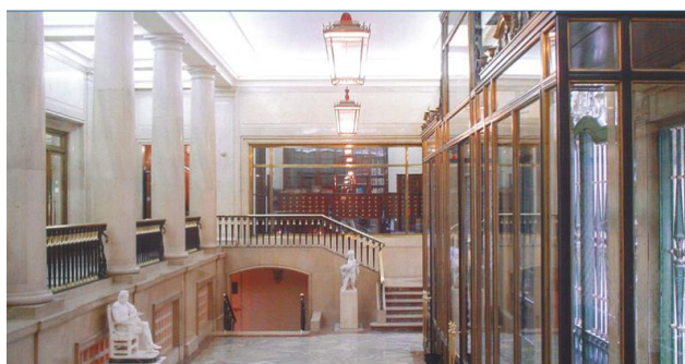
Foto 12: Panorámica del interior del Edificio INGESA con la biblioteca de fondo.