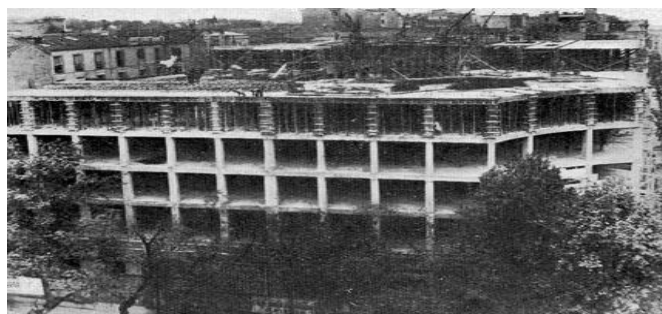
Foto 2: Edificio INGESA en construcción (Identificación del CEHOPU: I/FC-064/001).