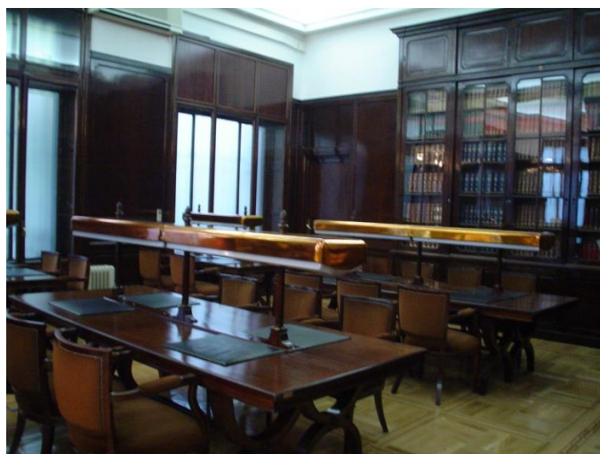
Foto 14: Puestos de lectura en la Biblioteca INGESA.