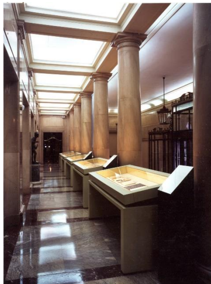
Foto 10: Galería que conduce hasta la biblioteca, con vitrinas para exposiciones.