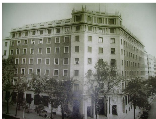
Foto 5: Vista general del Edificio INGESA).