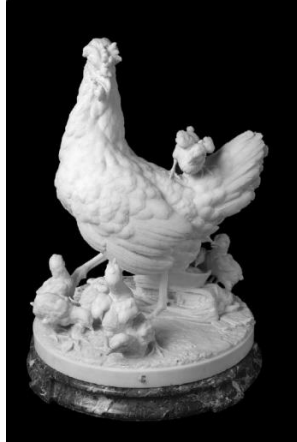
Foto 7: Giovanni Lombardi, Gallina con polluelos , 1868.